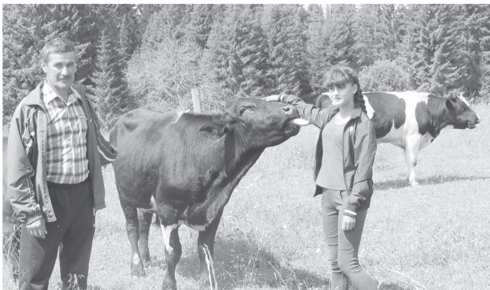
Медведевы со своими подопечными