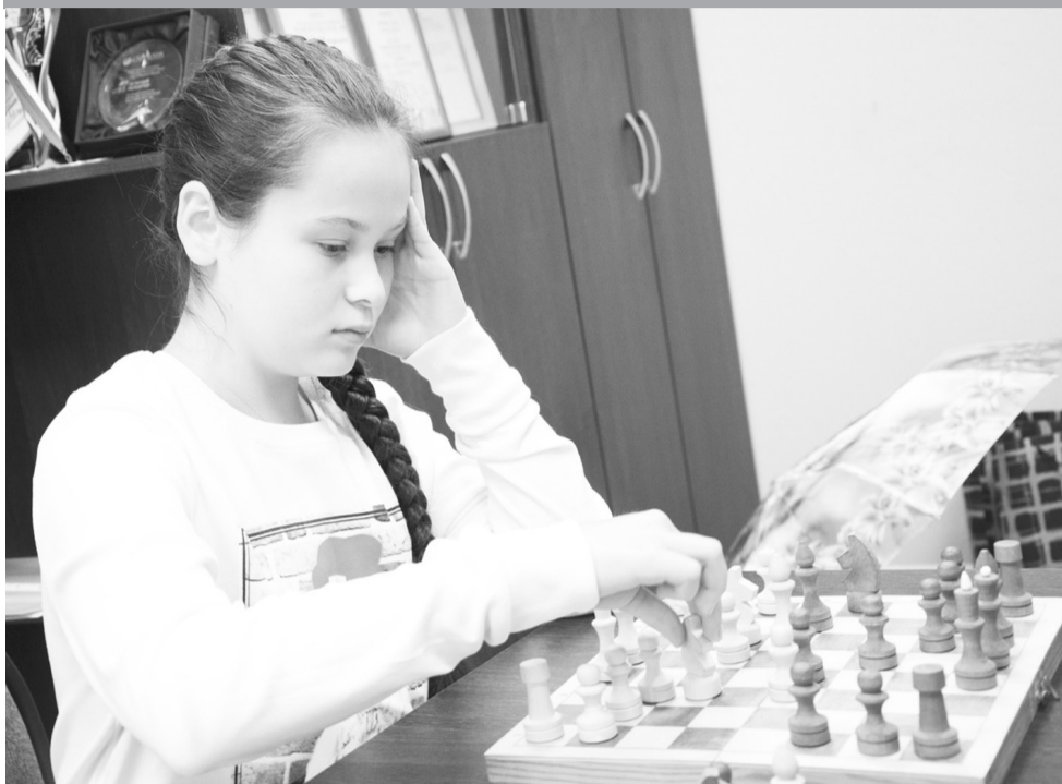
Игра требует сосредоточенности