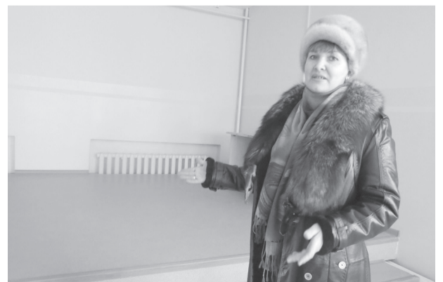
Вот оно, новое фойе в старом ДК

Корр. Что же, с Новым годом! Новых успехов, новых задумок, новых творческих свершений!