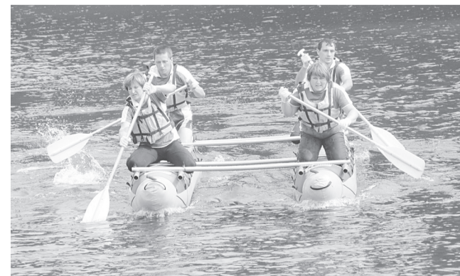
А я сижу, гребу веслом...