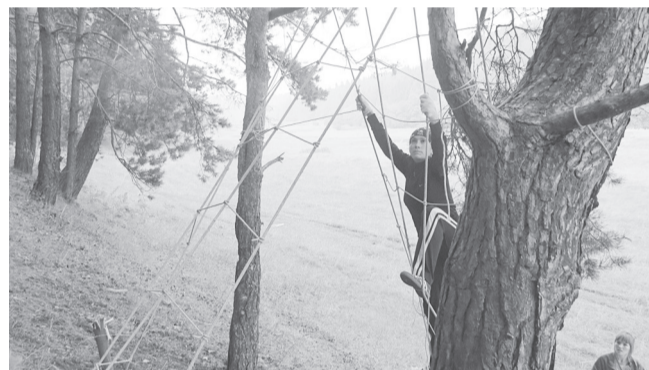
Ловкость тут не помешает