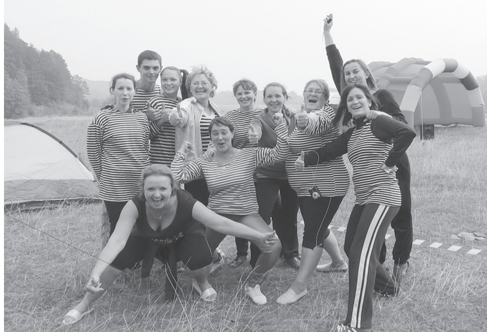
Потому что мы - банда!