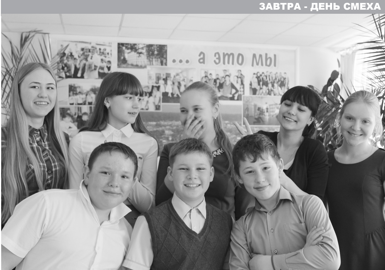
На уроках бейся, а в перемену - смейся!