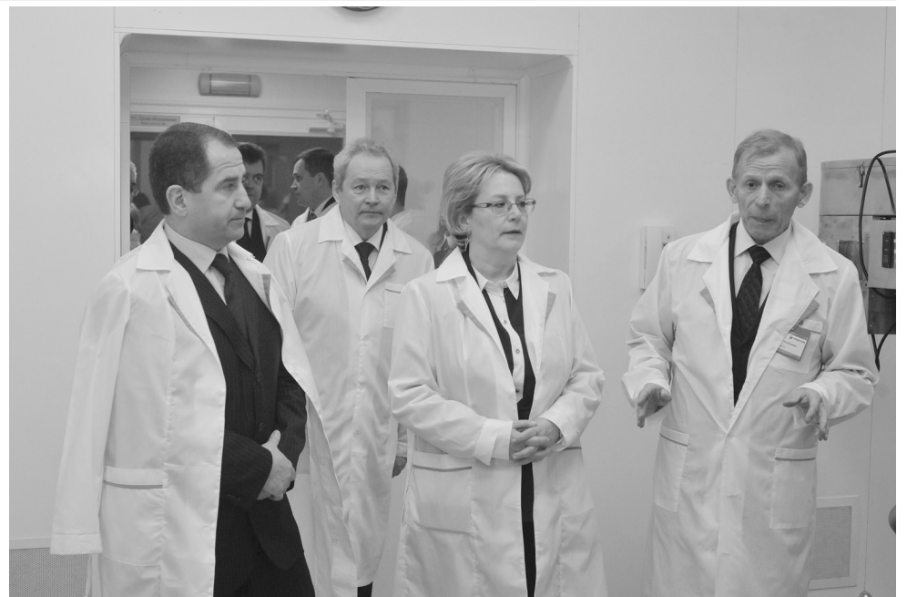
Экскурсия по цехам «Медисорба»

- Мы уже закупили часть оборудования, в апреле рассчитываем закончить