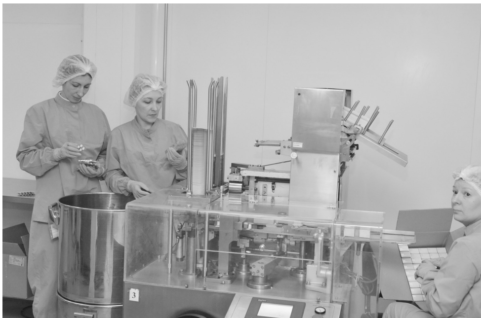
Популярные лекарства производят в Перми

- Обсуждение было очень полезным, - рассказал после завершения мероприятия губернатор. - И хотя было отмечено, что не все наши показатели медицинской деятельности находятся на высоком уровне, должную оценку получил факт, что удовлетворенность населения реформами, которые сегодня идут в отрасли, очень высока. Думаю, что мы и в дальнейшем очень много будем делать для того, чтобы отрасль здравоохранения системно развивалась. И в этом большую роль, я думаю, сыграет то, что сегодня мы получили уникальную возможность совместить решение системных задач и работу по текущим вопросам.