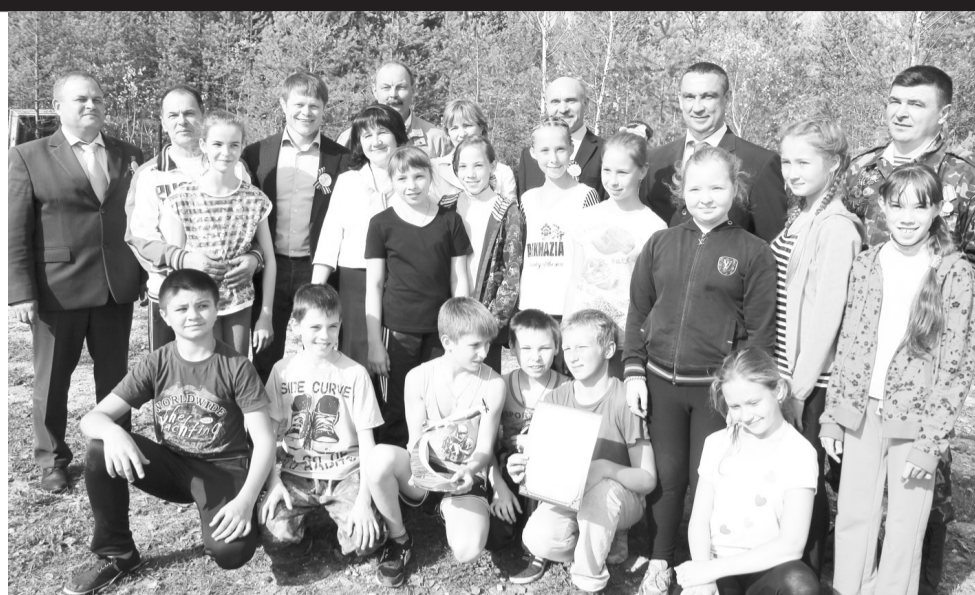
Наши дети любят спорт!