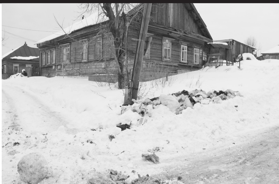
Обнаглел совсем народ: мусор в улицу несёт!..

Уверена, теперь жители не только этих улиц станут осматривательнее, и мусор, что кидают куда ни попадя, начнут тщательно сортировать, чтобы в мешок не попала ни одна улика, но ведь и мы не собираемся сидеть без дела. В запасе есть ещё один метод: устраивать возле мусорных куч сады, чтобы всё-таки взять нарушителя с поличным. Зря,