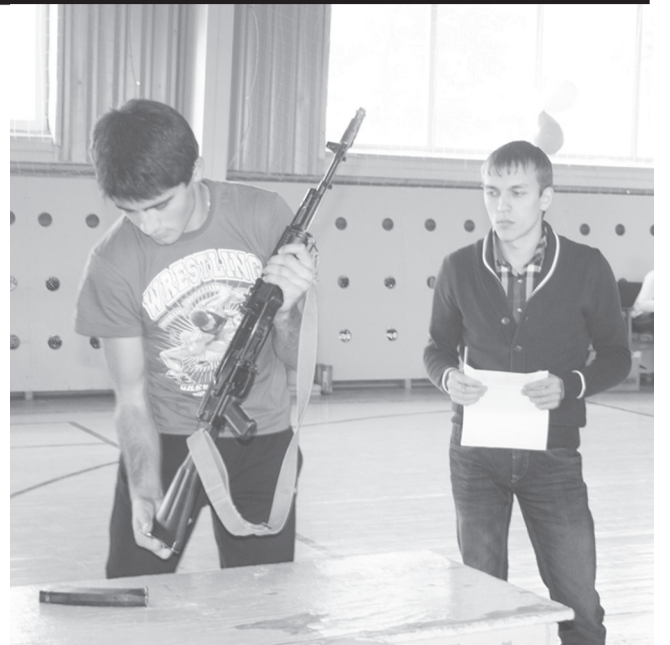
Разборка оружия - на отлично!

Парни меряются силами в пяти этапах конкурса. Воли к победе не занимать ни у нынешних школьников, ни у призванных. Быстрее ветра преодолевая дистанции, они тут же отжимаются, четкими, точечными движениями разбирают и собирают автомат Калашникова, укладываются в норматив по надеванию спецкостюма спасателя (хотя многие видели его впервые), с меткостью снайперов бросают в цель теннисные мячи, достойно преодолевают эстафету с препятствиями в про-