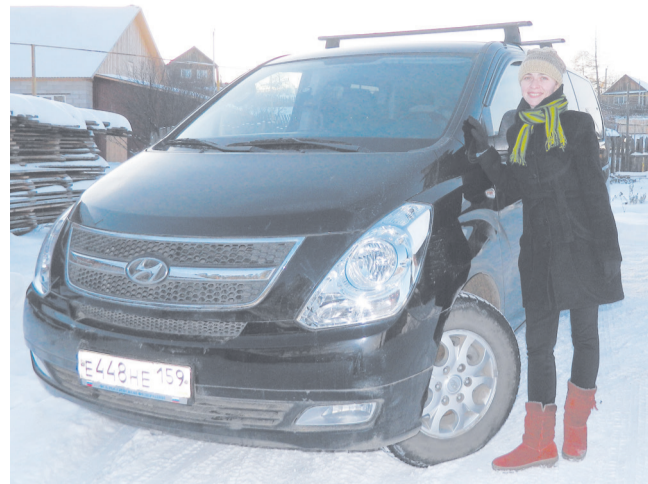
Тандем: хрупкий водитель - мощное авто - «Всегда везёт»

Корр. Ну, а просто, скажем, на рынок съездить в большой город или там в тор-