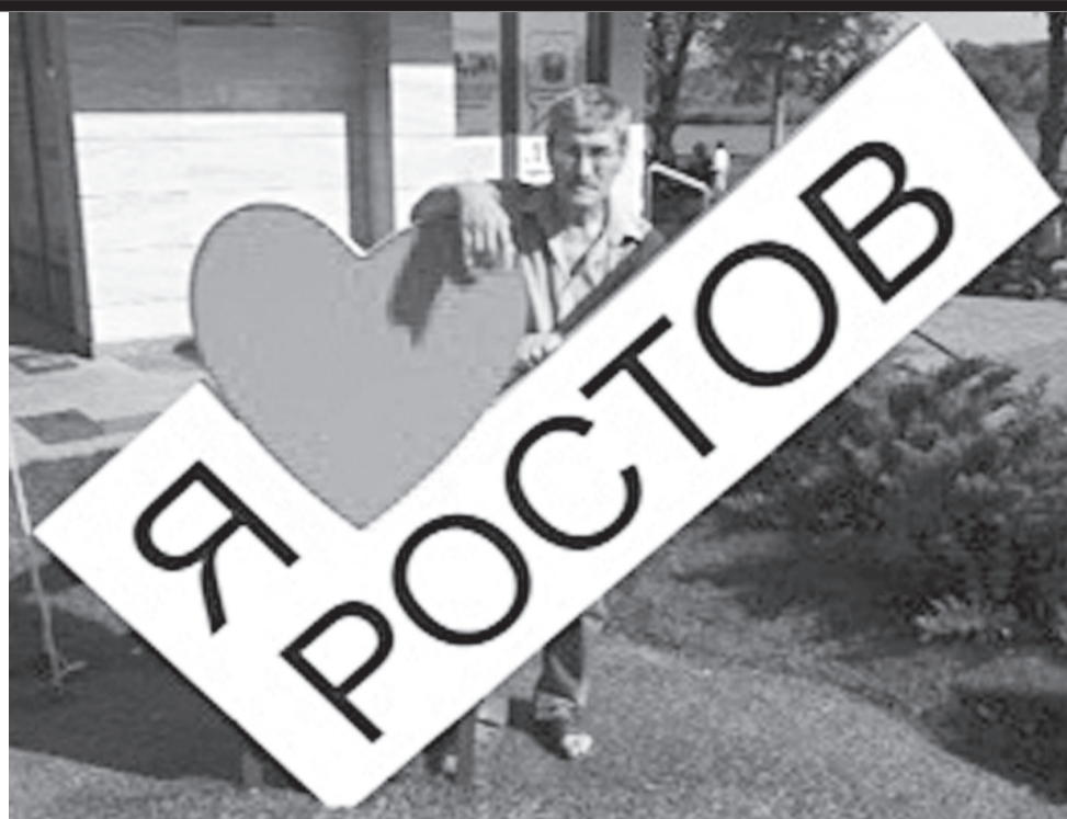
В гостях хорошо!..

...Отдыхал, гулял по городу, часто до ночи. Днём любил в парке имени Вити Черевичкина посидеть. В центре парка памятник ему стоит. Пионергерой. Во время войны был подпольщиком, сведения о фашистах передавал Красной армии. Гансы парня вычисли-