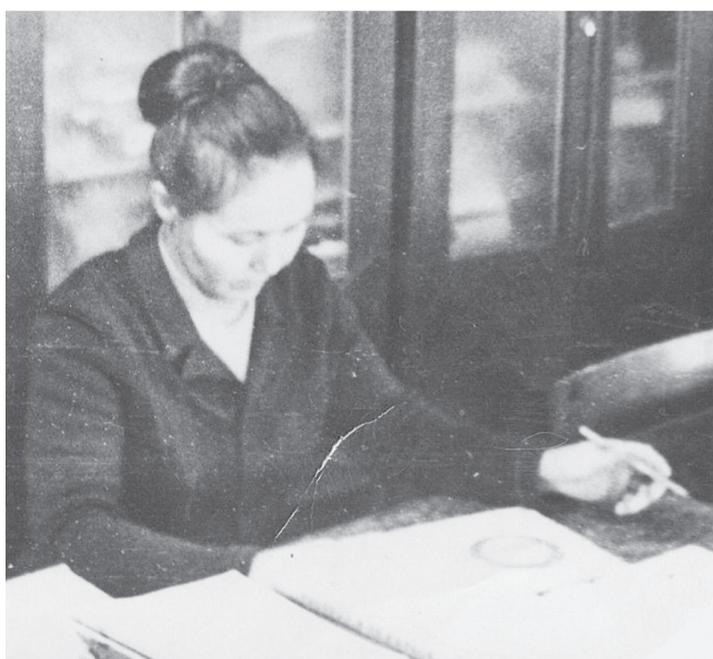
А.Г.Либалова, фото из архива