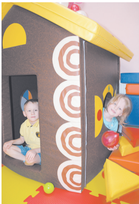
Кто-кто в теремочке живёт?!

Куда пристроить ребёнка, если нужно срочно сбегать по неотложным делам? Куда-куда?! В «Лесную сказку», конечно! Об открывшейся новой детской игровой комнате только и разговоров в посёлке. Подобные детские центры уже получили признание в небольших городах. Группа в социальных сетях по этому поводу давно сформировалась. Сегодня и мы расскажем о новинке.