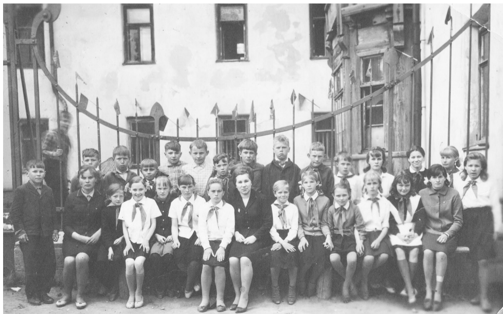
Загляните в семейный альбом!..

А пока - снимок конца 60-х на фоне Дома Каменского – бывшей средней школы. На обратной стороне надпись: 19 мая, День пионерии. Может быть, кто-то узнает среди этих мальчишек и девчонок себя. А не находите ли знакомой самую жизнерадостную пионерку на этом снимке?