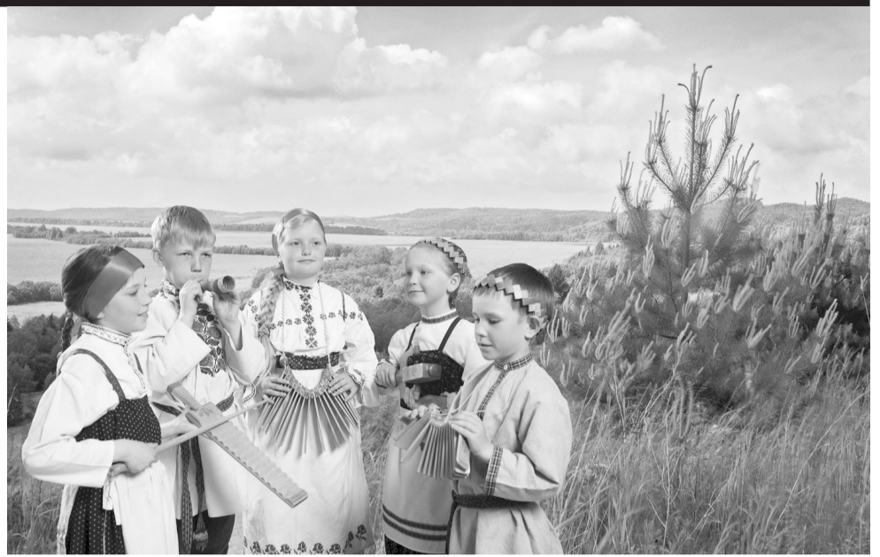
На территории Пермского края дружно живут представители более 125 национальностей.

Получив одобрение Президента, главы вынесли вопрос о слиянии регионов