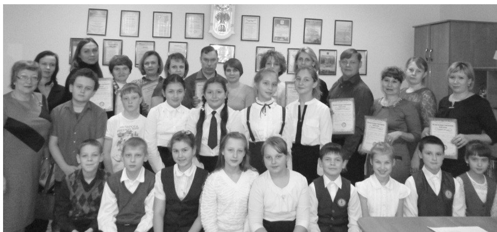
Умники и умницы СОШ № 2