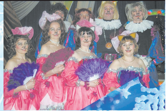
Ключевские кошечки и котики

И ничего, что глушь! В лесной сторожке в самый торжественный момент присутствуют все новогодние атрибуты: как и положено – бой кремлёвских курантов (в конце концов, для этого сойдёт и магнитофонная запись), праздничная речь президента России Владимира Путина (у внешне похожего на главу го-