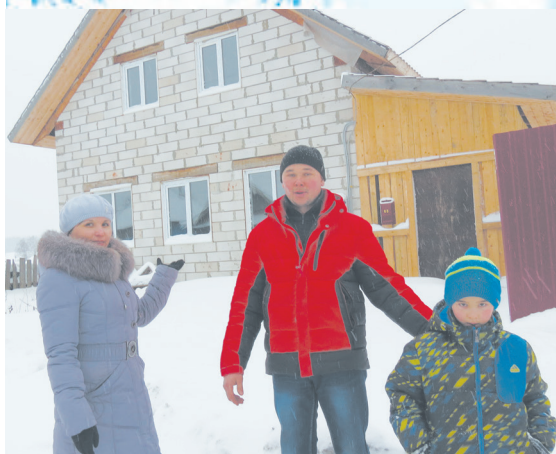
... И оживёт семейное гнездо!

А мы с удовольствием поздравляем всё семейство с Новым годом и желаем такого же оптимизма, жизнелюбия, активности и много-много удачи!