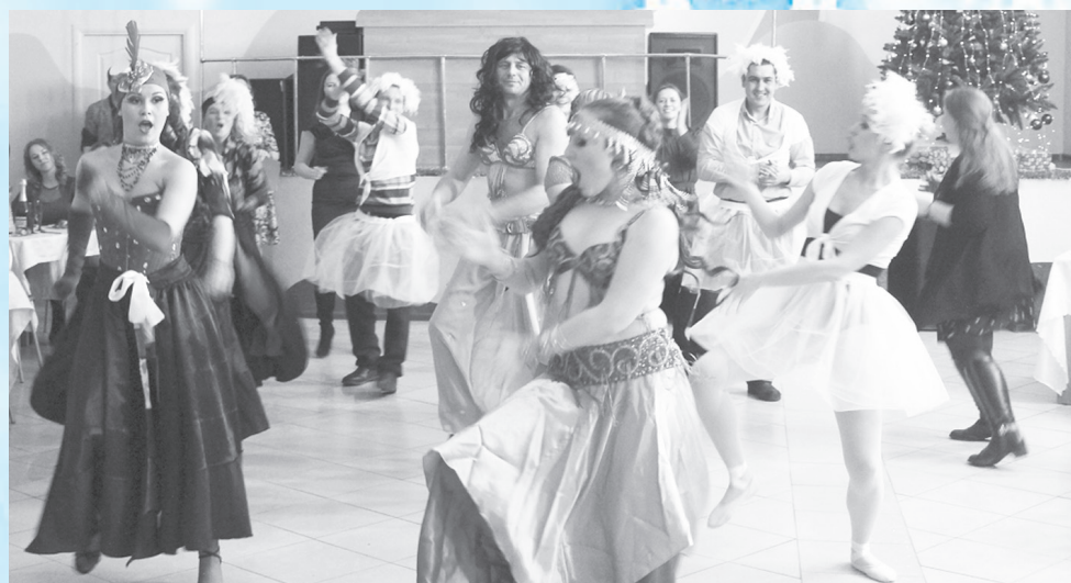
Ах, эти чудные мгновенья!