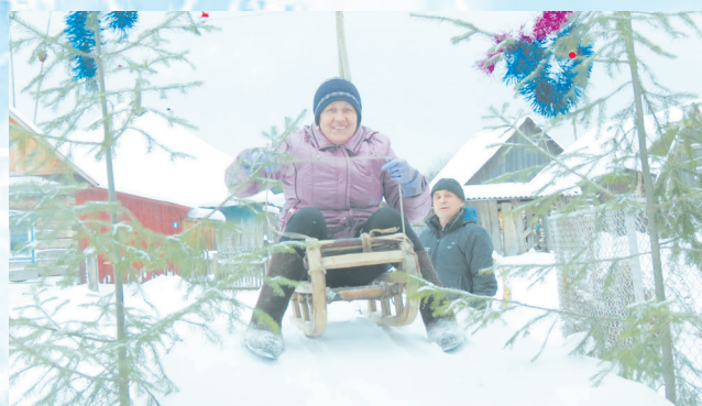
В ожидании внучат и горка, и салазки в деле