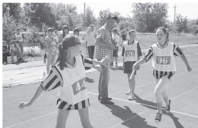
На последнем этапе

Что ж, значит, юниорам есть к чему стремиться. Впрочем, тренеры сами знают