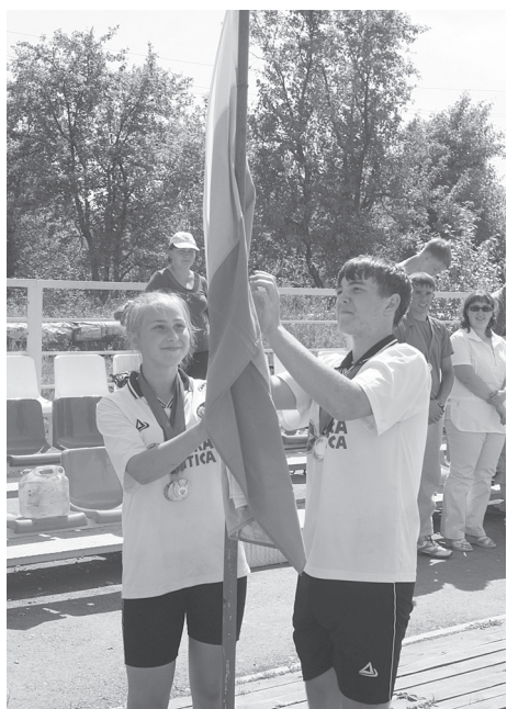
Под гимн России...

Впрочем, для большинства спортсменов отдых начнется только после проведения районного детского турслета, который начал