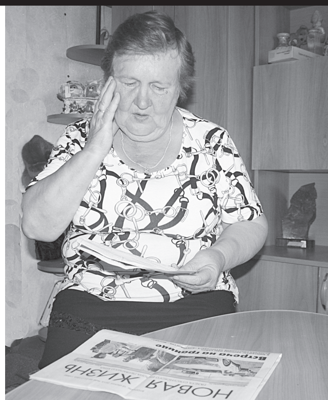
Удостоверьтесь, что вам начислена плата за ОДН с учётом предельного объёма

– После изменений в законодательстве мы посмотрели ряд многоквартирных домов, и получилось, что плата по водоснабжению на ОДН снизилась примерно на 30%, – отметил краевой министр энергетики и ЖКХ Александр Фенев. – Начислять плату на ОДН с учетом предельного объема обязаны все УК и ТСЖ. Причем, оплата