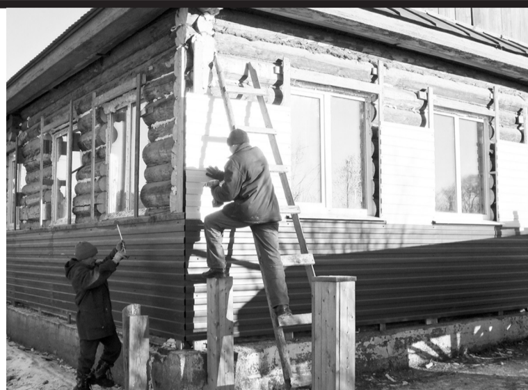
Новая жизнь старого здания

Открытие музея планируется приурочить к дню рождения многонационального Пермского края, т.е. к 1 декабря.