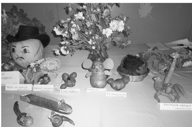
Вот такие чудеса!