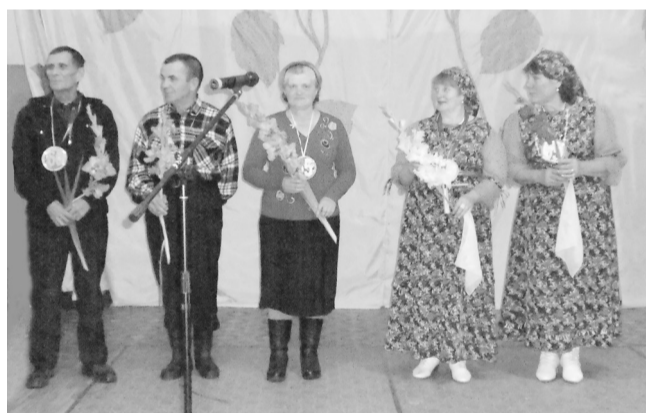
Посвящаем в пенсионеры!

«Когда мы были молодые». Для многих это было неожиданностью. Наши пенсионеры принимали участие во всем: выставке выращенных овощей, причудах природы, оформлении праздничного