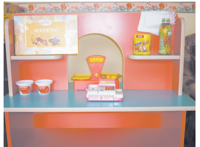
... и настоящая витрина

Потому и сотрудники и сельские ребяткишки ни на чуточку не почувствуют себя обделёнными. Ведь мы все хотим, чтобы наши сельские дети выросли добрыми, умными, талантливыми. И уверены, что развивающие материалы, изготовленные своими руками, с желанием и теплотой, им в этом помогут.