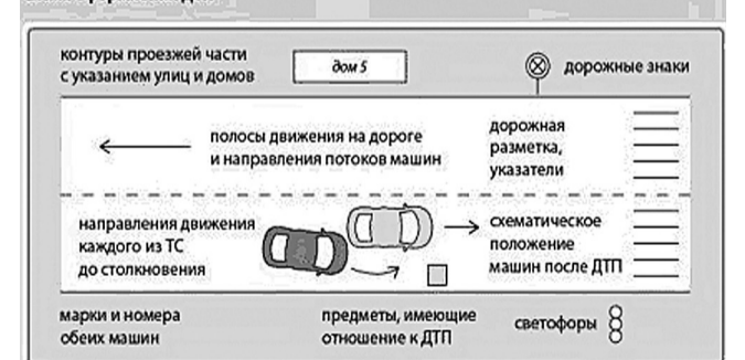
Схема оформления ДТП

санным выше образом, можно разъехаться. Затем водитель должен в течение 5 рабочих дней с момента ДТП отправить извещение о наступлении страхового случая в свою страховую компанию. Если виновником ДТП оказался второй водитель, а вы претендуете на получение