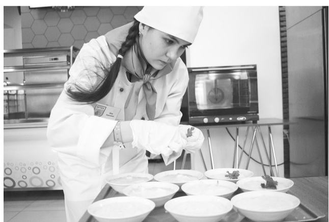
Хорошая статья о мастер-классе французской кухни требует полного погружения в роль шеф-повара

Традиция будет продолжена – II Медиафорум «Артек» состоится в октябре-ноябре 2016 года.