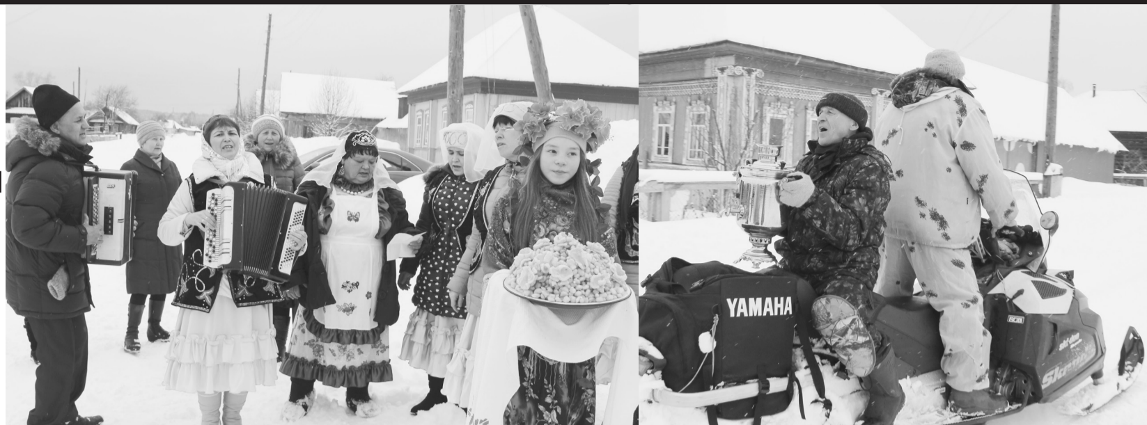
С Весной и песнями - от дома к дому

Действительно, в минувшую субботу сквозь снежные заносы пробраться к полудню на празднование национального праздника Навруз для многих гостей оказалось довольно проблематичным. Кто же мог подумать, что зима не просто вернется, а напоследок ударит таким снегопадом, которого никто не ждал. А вот Навруз поджидали! Местные хозяйки наварили-наготовили такие вкусности, что столы ломились от щедрот сельчан. Ведь этот праздник отмечается широким гулянием