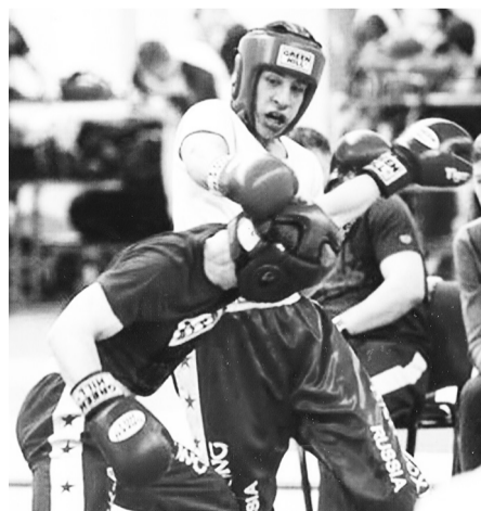
Удар, ещё удар!