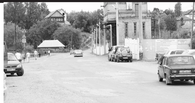
И плотину «вылечат»!

поворота с К-Маркса и т.д. Полностью (через всю ширину) отремонтируют плотину и часть улицы Калинина. Причина такой частичности объясняется отсутствием достаточных финансовых средств, поскольку все расходы по ремонту ложатся исключительно на местный бюджет. (Для справки: одна только проектная документация на ремонт участка дороги Ключи-Брёхово, например, обойдётся без малого в 13 млн. рублей). Общая площадь нашего дорожного ремонта составляет