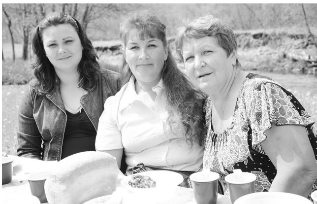
Их конёк - животноводство