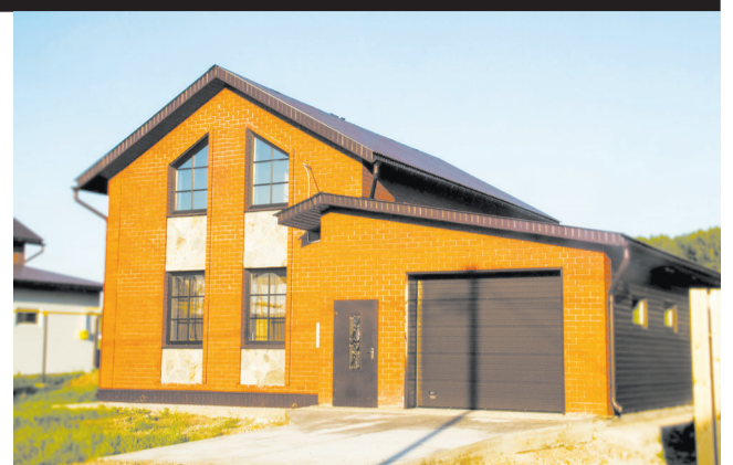
Строительство домов происходит по единому типовому проекту

На качество любого дома компания предоставляет 5 лет гарантии! Заключив договор, на протяжении всего строительства вы получаете ежемесяч-