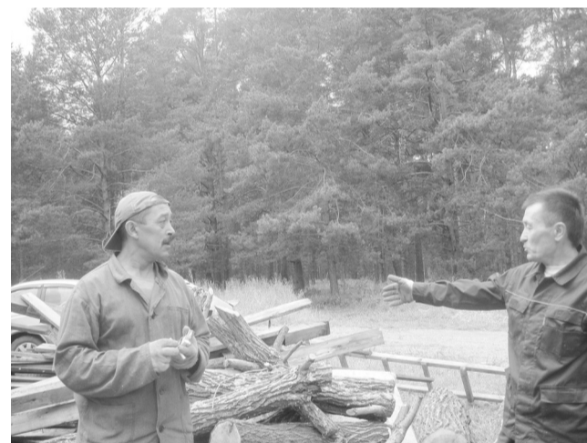
Фронт деятельности не мал!

Как уже сообщалось в районной газете, в Суксуне идёт реконструкция бывшего здания ветлечебницы под мечеть. Место освящено представителем мусульманского духовенства края, уже идут восстановительные работы.