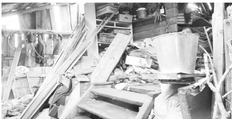
Где-то здесь вход в избу