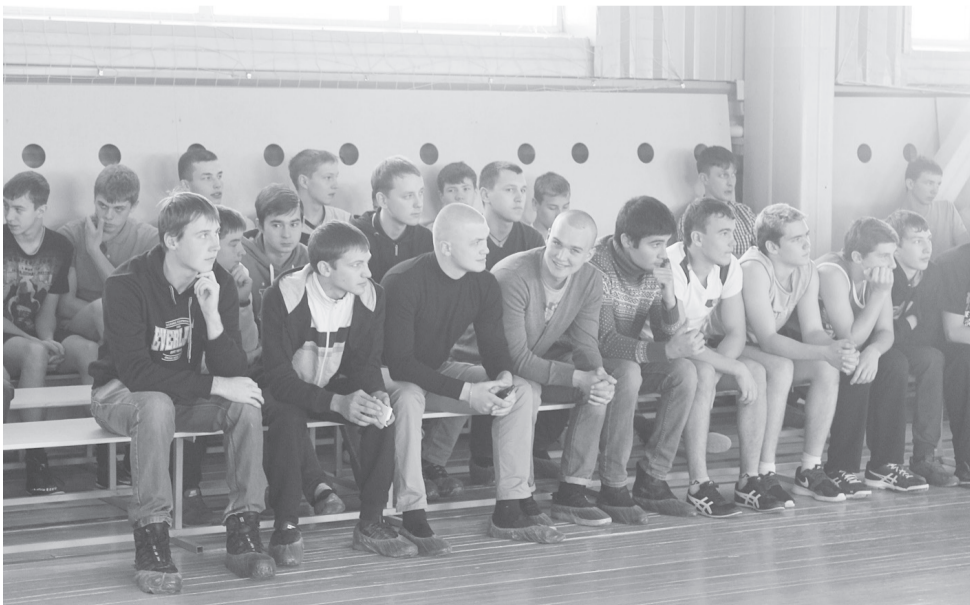
Солдатами станут мальчишки...