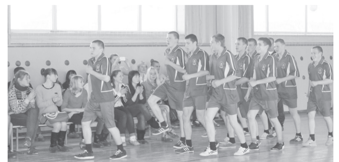
Все мы парни обыкновенные!..