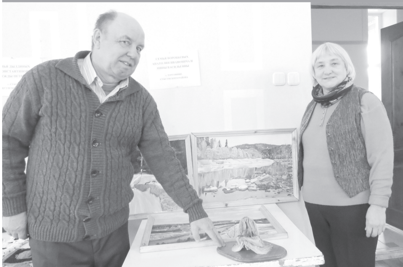
Супруги Воробьёвы поменяли город на деревню