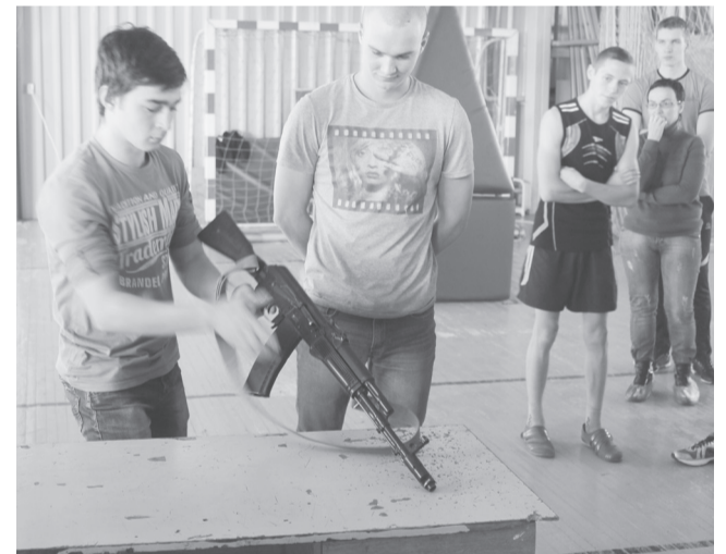
И с автоматом справился!

ОТДЕЛ ВОЕННОГО КОМИССАРИАТА ПО ПЕРМСКОМУ КРАЮ КИШЕРТСКОГО И СУКСУНСКОГО РАЙОНОВ ПРОДОЛЖАЕТ НАБОР В ВООРУЖЕННЫЕ СИЛЫ РФ ПО КОНТРАКТУ МОЛОДЫХ ЛЮДЕЙ, ОТСЛУЖИВШИХ В РЯДАХ ВООРУЖЕННЫХ СИЛ РОССИЙСКОЙ ФЕДЕРАЦИИ, НЕ ИМЕЮЩИХ СУДИМОСТИ. ПРЕДОСТАВЛЯЮТСЯ ЖИЛЬЕ, СОЦИАЛЬНЫЕ ГАРАНТИИ, ВЫБОР МЕСТА СЛУЖБЫ. ЗА ДОПОЛНИТЕЛЬНОЙ ИНФОРМАЦИЕЙ ОБРАЩАЙТЕСЬ В ВОЕНКОМАТ П. СУКСУН.