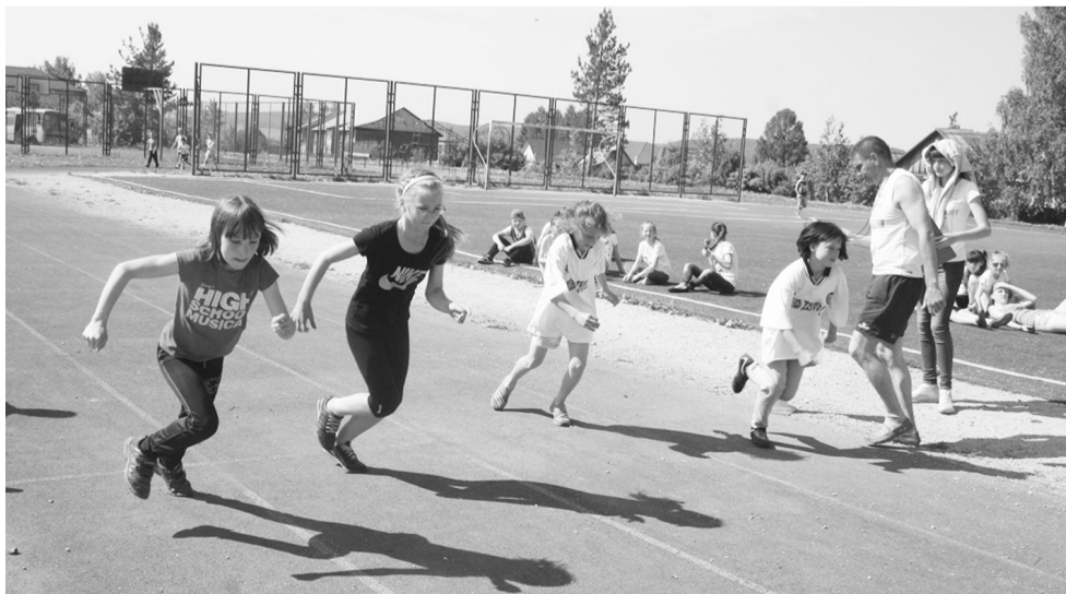
На старт! Внимание! Марш!