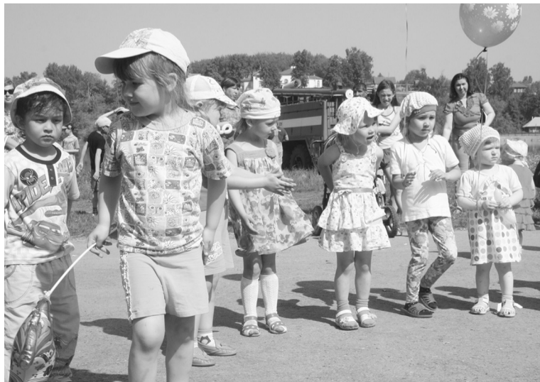
Дети летом и под присмотром, и заняты

Марафон предпринимательских инициатив проходит в рамках проекта творческая лаборатория предпринимателей «ЕДИНЕНИЕ», реализуемого Пермским фондом развития предпринимательства по заказу Министерства промышленности, предпринимательства и торговли Пермского края.