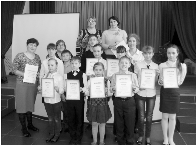
Умники и умницы ДШИ

В Суксунской Детской школе искусств состоялась первая научно-практическая конференция для учащихся всех отделений школы «Все об искусстве». В оргкомитет конкурса поступило много работ от желающих принять участие в конференции, но жюри отобрало двенадцать самых интересных.