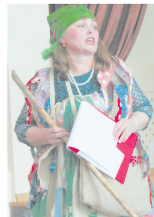
«Визитка» бывает такая

До последней минуты сохранялась интрига при оглашении имени победителей конкурса, для которых победа, судя по всему, стала просто неожиданностью. Но самое главное, как верно отмечали все выступающие с приветственными словами, это не единственно победа в конкурсе. Уже одно только участие в такого рода мероприятии – это большая и значимая победа. И прежде всего – над собой, своими страхами, своей неуверенностью. Как показал конкурс, девчонки (ну кто бы из нас обиделся на такое обращение?) не просто молодцы. Они – настоящие профессионалы! Любящие детей и любимые ими.