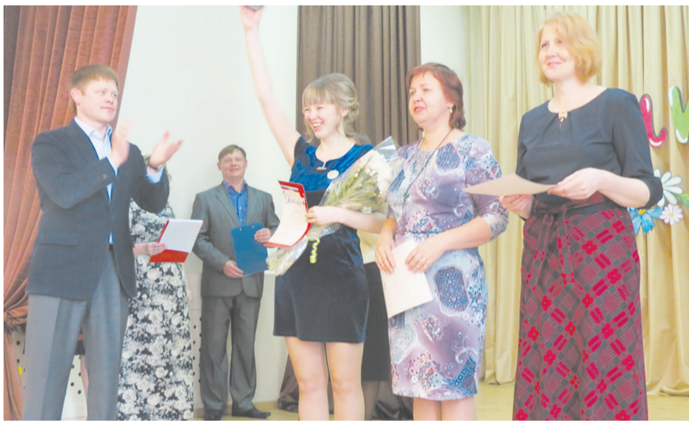
Поздравление от депутата ЗС края