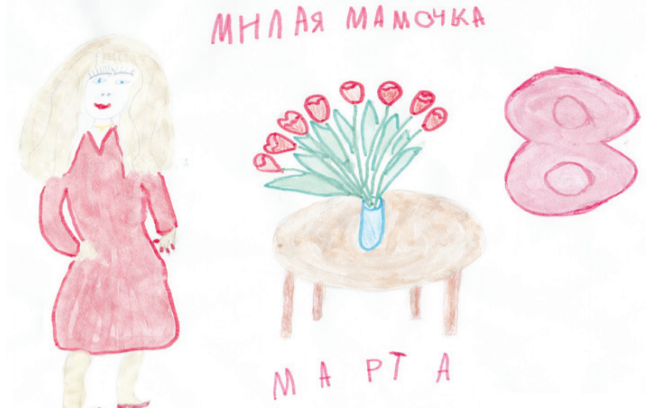
Мама Наталья Чукомина /Матвей Чукомин (4,5 года)