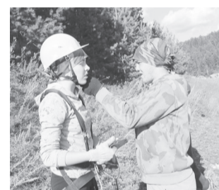
Каску надо закрепить!

Водный туризм – «Укротители огня» Гандбол – «Дружина» Турлагерь – «Шизофрения» Конкурс приветствий – «Трудоголики» Туристическая мода – СОМЗ Конкурс поваров – «Территория 02»