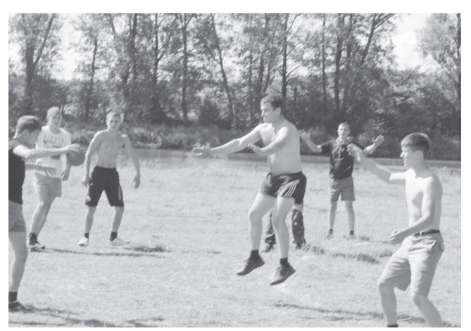
Мяч на игру!