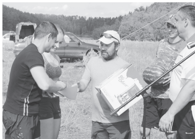
И арбуз впридачу