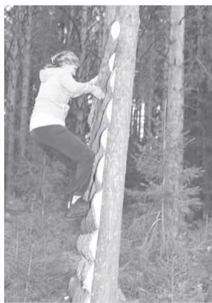
Покорится и стена