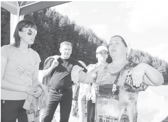
Команда, слушай сюда!