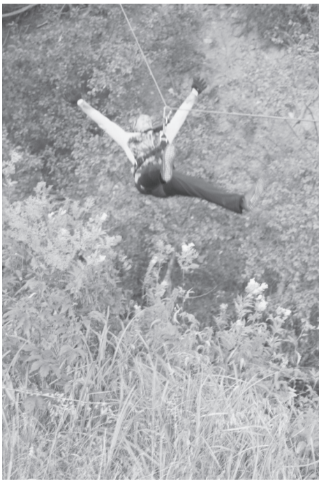
В свободном полёте

Смотр бивуаков тоже проходил под эгидой нестарящего фильма и гласил «... Вешайте коврики на штукатурку!» Некоторые команды, видимо, поняв призыв буквально, даже привезли с собой целые ковры!