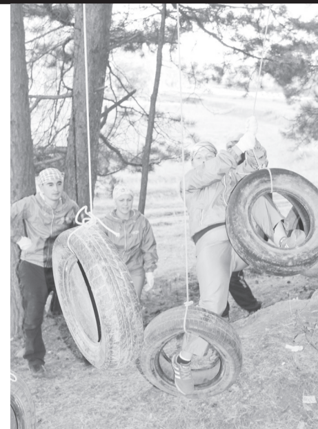
Эти злополучные колёса...