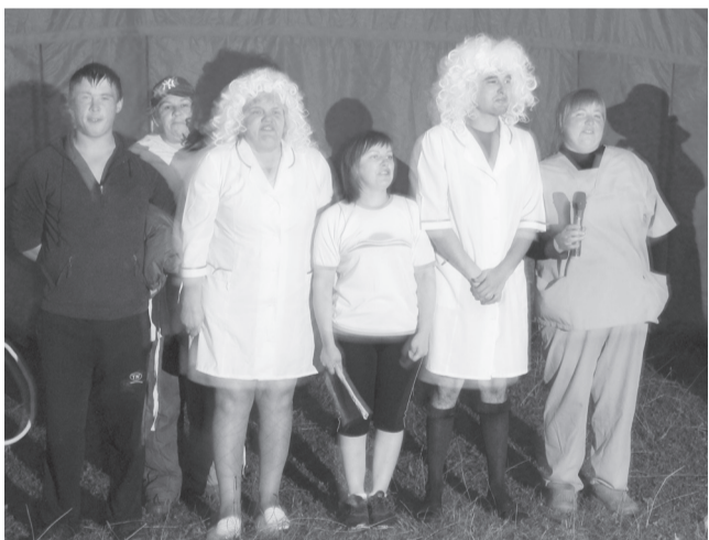
Вот такая «Визитка»