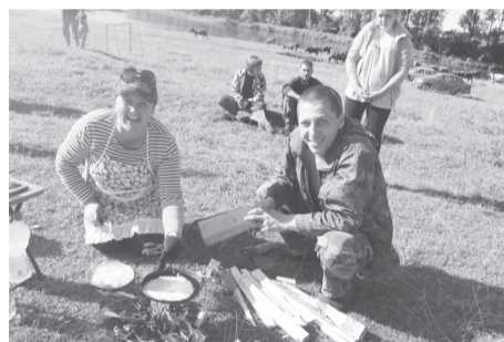
Блины с припёком и без