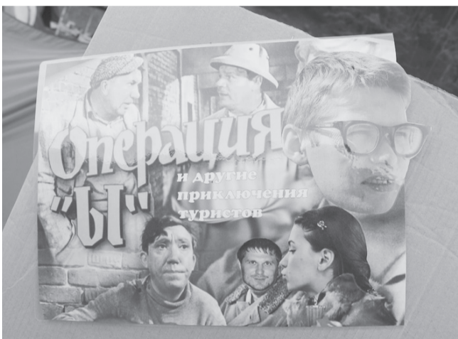
Операция "Ы" по-СОМЗовски