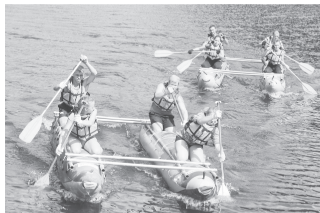
Нас не догонят!