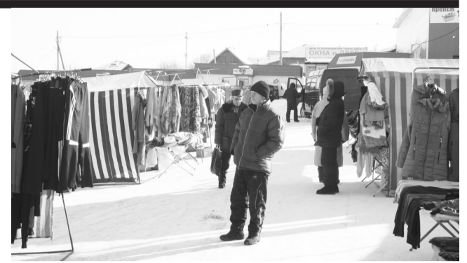
На Суксунском рынке

Представитель Роспотребнадзора обратил внимание на многие вопросы, касающиеся деятельности предпринимателей. Один из них - о существующем регламенте Таможенного союза. В полномочиях Роспотребнадзора порядка двадцати технических регламентов: безопасность мяса и мясной продукции, молока и молочной продукции, масло-жировой и других. Здесь было рекомендовано предпринимателям изучить технические регламенты, а проще говоря, основные требования к продаваемым товарам, обсуждалась возможность проведения представителями Роспотребнадзора семинара по безопасности широкого спектра продаваемой продукции у нас в Суксуне.