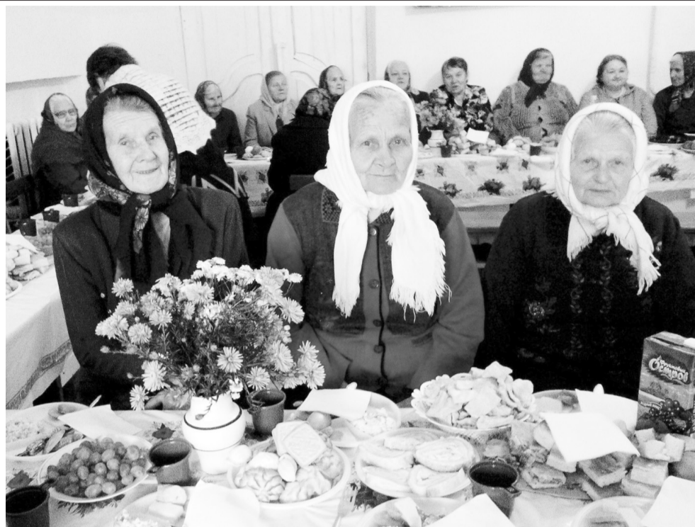
Честь и хвала возрасту мудрости!