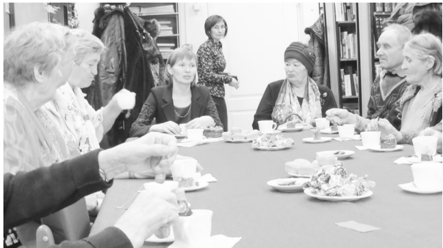
У каждого своя история жизни...