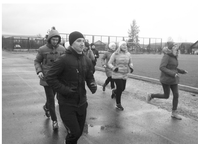
Бегом за здоровьем!