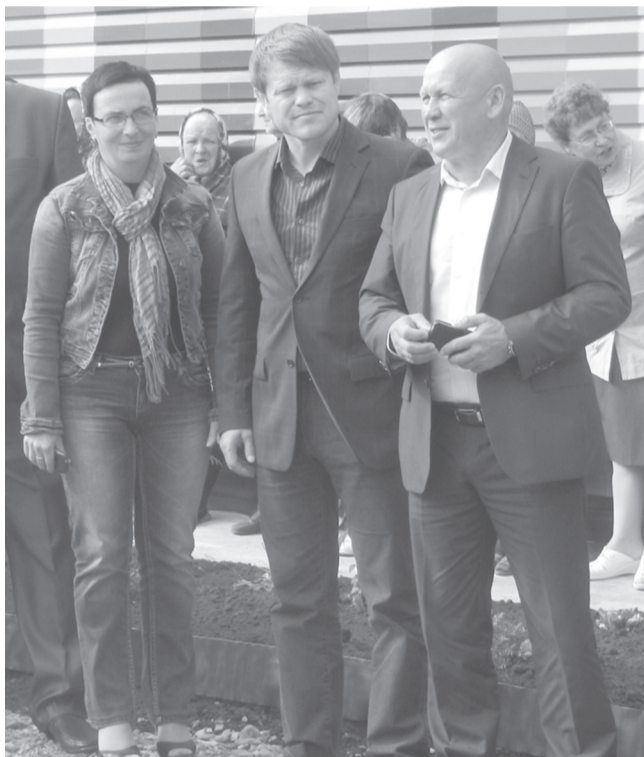
На открытии детского сада в Сабарке