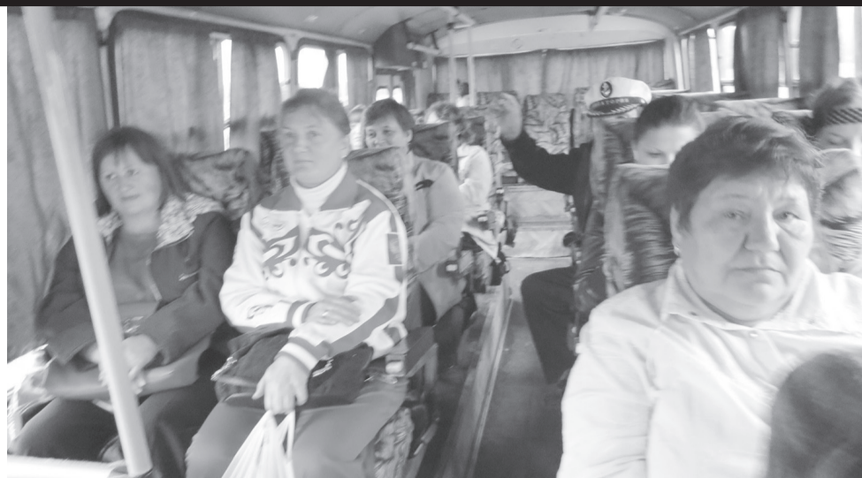
Мы едем, едем, едем...

В Шахарово, на удивление, пробка на этот раз тоже небольшая, так что быстро добираемся до Ключей.