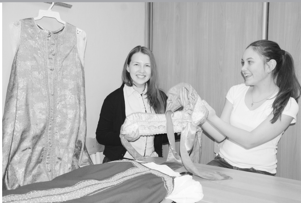
... И удачные во всех смыслах костюмы!

Ну, а весь состав нашей «Зореньки» стал лауреатом этого конкурса.