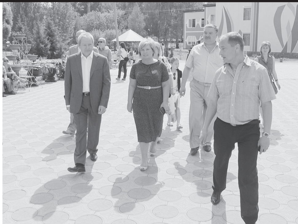
Губернатор Виктор Басаргин побывал в детском загородном лагере «Новое поколение»

После линейки губернатор провел заседание за круглым столом, где обсуж-