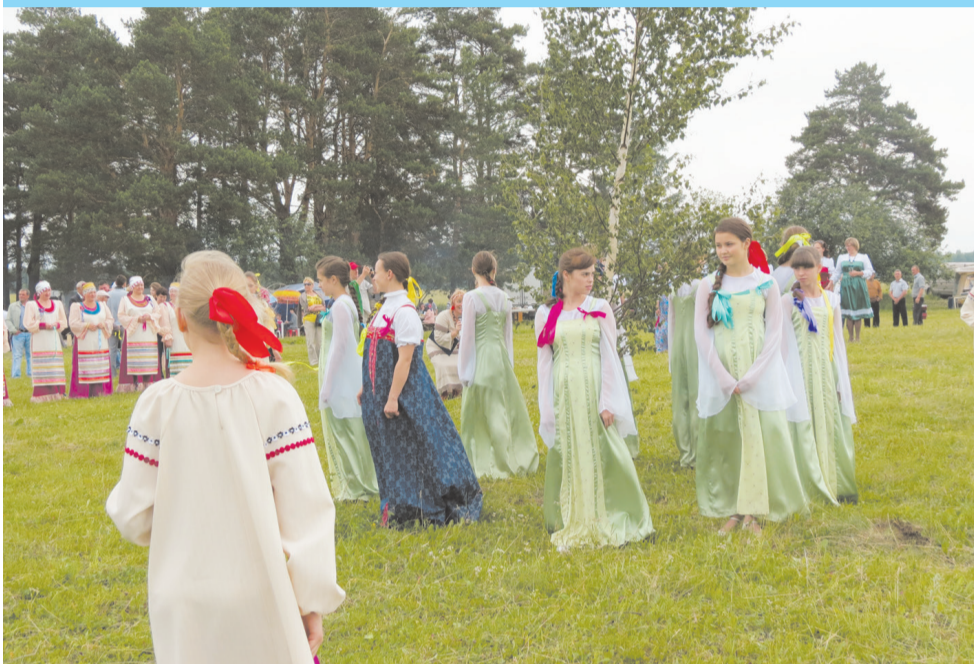
Завивали девушки берёзку...