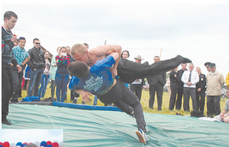
... и борцы в полёте

мом центре - высокий столб, на котором в дальнейшем взбирались молодые пары, это как на нашей русской зиме. А по периметру расположились палатки и батуты. В палатках продают и шашлык, и шаверму. Скачет малышня на батутах, рассекает на электромотоциклах,