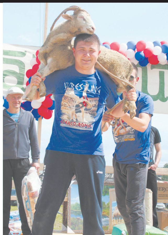
... и настоящий батыр!

вают матрасы, регистрируются, и начинается самое интересное! И не только для меня. Вокруг толпится много народу