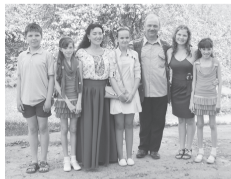
Выпускной - всегда немножко грустно