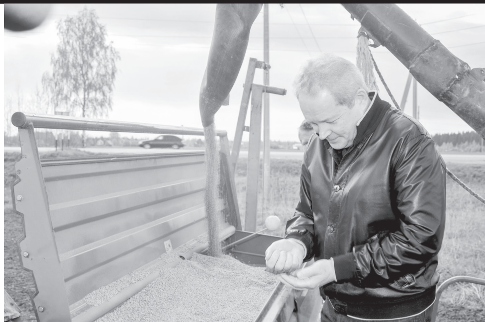
Губернатор оценил качество семян

- Решение проблемы аварийного жилья заключается не только в получении финансирования из Фонда ЖКХ на расселение жителей, но и в использовании ресурса Фонда капитального ремонта, - отметил глава региона. - За 2014 год мы расселили в крае около 40 тыс. кв. м.