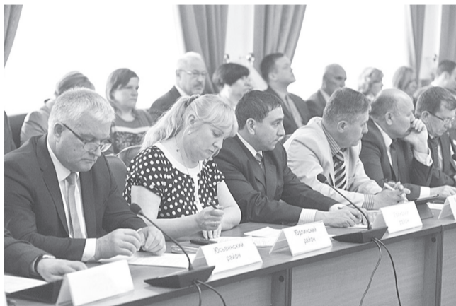
Идет заседание совета глав