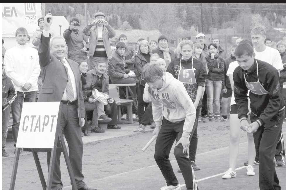
Губернатор дает старт эстафете на новом стадионе в с.Уинское

Один из «свежих» объектов – современный межшкольный стадион в селе Юрла Коми округа. В июле этого года на его открытие собралось все местное население – от мала до велика. Стадион понравился всем и сразу. Здесь есть все, что и должно быть на сооружениях такого рода, – трибуны, беговые дорожки, несколько игровых площадок. На поле – мягкий искусственный газон. Первыми свои восторженные оценки выдала ребятня: «Можно босиком играть, и, если упал, больно не будет. И зеле-