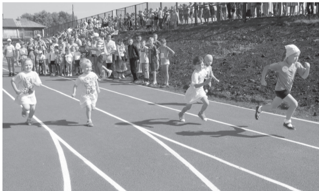
Соревнования на стадионе в с.Юрла Коми-Пермяцкого округа