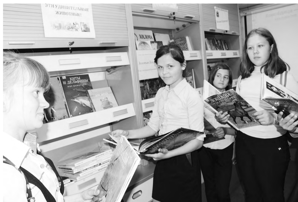
Нам с хорошей книгой по пути

Библиобус уже посетил более 35 муниципальных образований края. Пришлось пожалеть лишь о том, что реально предлагаемые здесь книги можно взять и прочесть в только фондах Пермской библиотеки им. Горького, которая и курирует передвижной комплекс информационно-библиотечно-обслуживания.