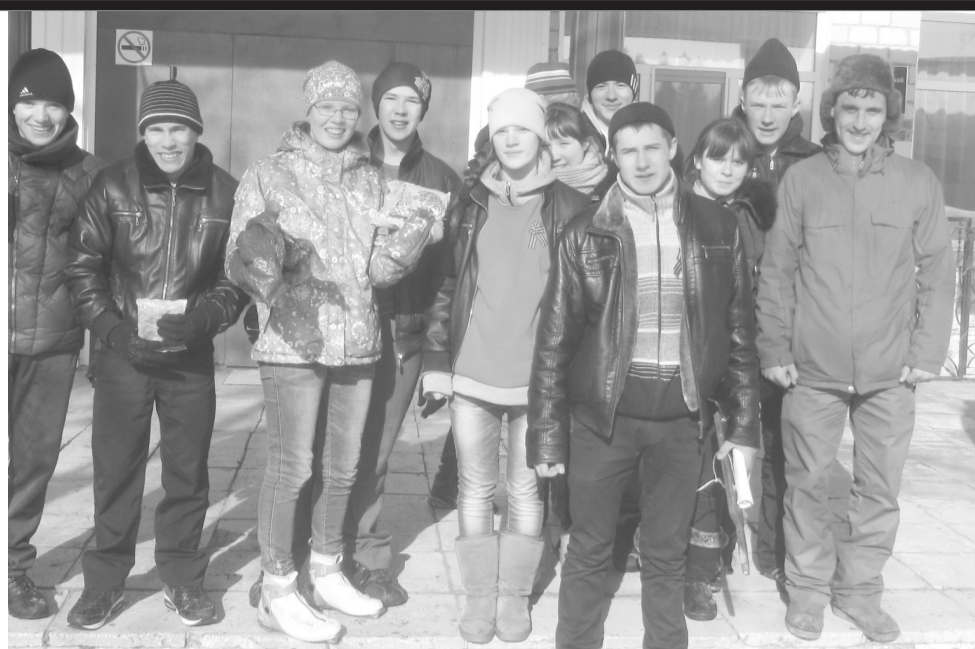
Команда - победительница

Меж тем эстафета продолжается. Медсанчасть. Здесь участники отвечают на