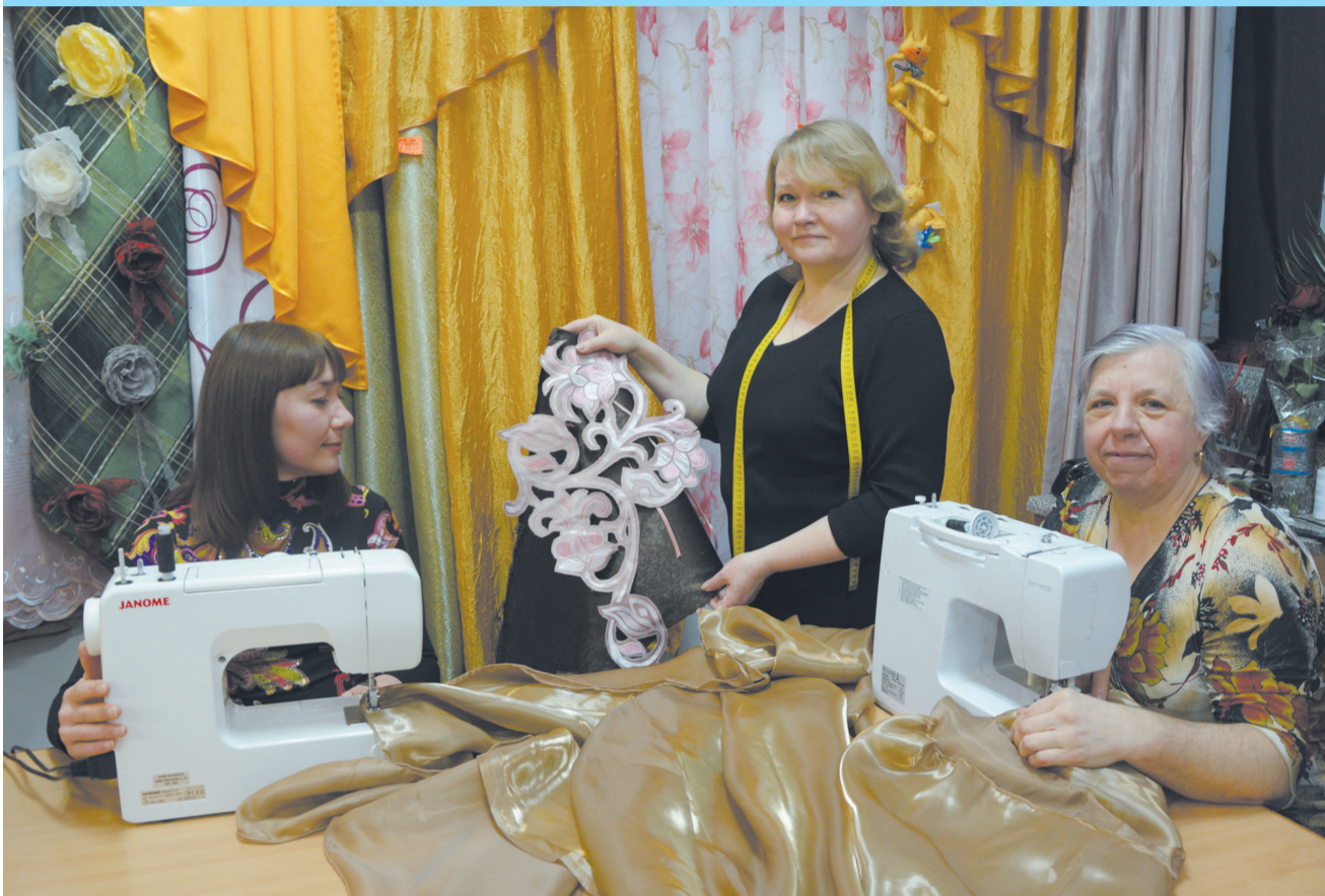
Вот они - швей-мастерицы!..