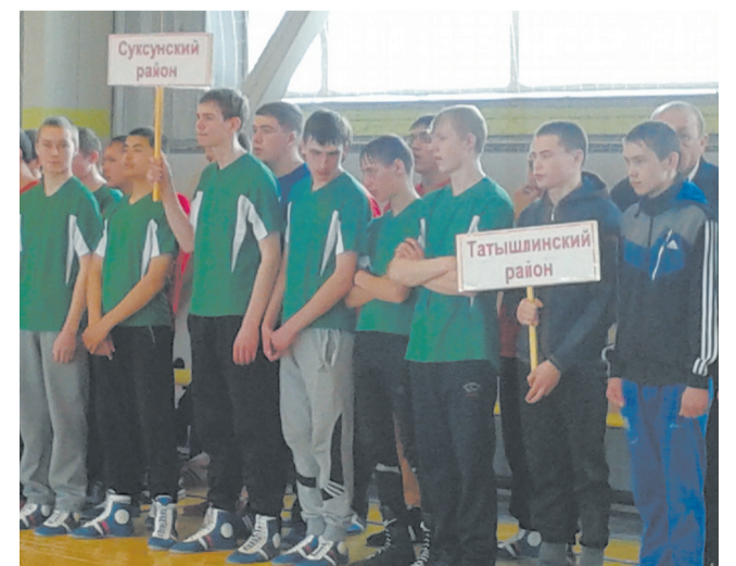
В общем строю наши лидеры