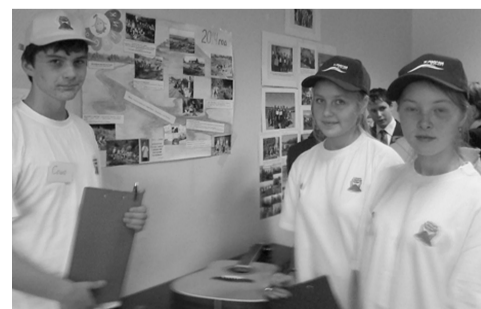
Юные экологи - за чистоту малой родины

селения и администрации просто не справится. Приглашаем к сотрудничеству администрацию Ключевского поселения в реализации новых проектов, акций на благо нашей малой родины - села Ключи.