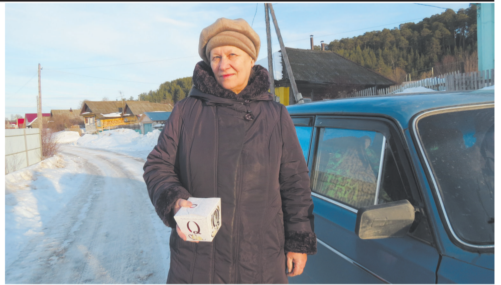
...И подарок от фирмы

Кстати сказать, лотереи эти проводятся каждое воскресенье. Так что, если пожелаете, приз у вас в кармане. Или пополненный счёт на мо-