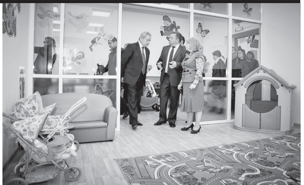
Скоро 120 малышей пойдут в новый детский сад

тору и еще одну проблему района в сфере образования - нехватку мест в начальных классах школ.