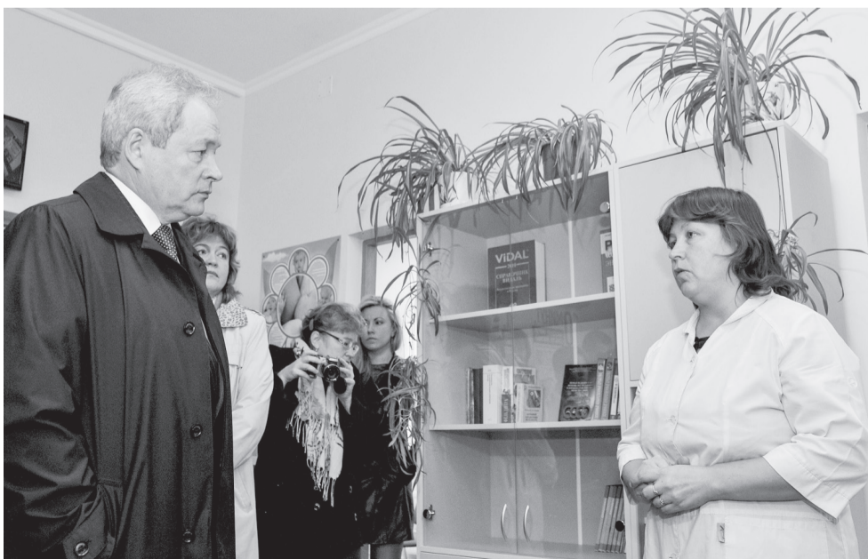
В фельдшерско-акушерском пункте все по высшему разряду

Также мы договорились о строительстве дома для педагогов. Здесь есть школа, и очень не хотелось бы, чтобы она закрылась из-за нехватки учителей. Кроме того, обсудили с руководителем хозяйства вопрос о новой линии глубокой переработки молока. Ее нужно поставить здесь, чтобы никуда не везти сырье. Пришло время строить! К тому же ни одно хозяйство сейчас не вкладывает в развитие села так много, как это делает «Нива».