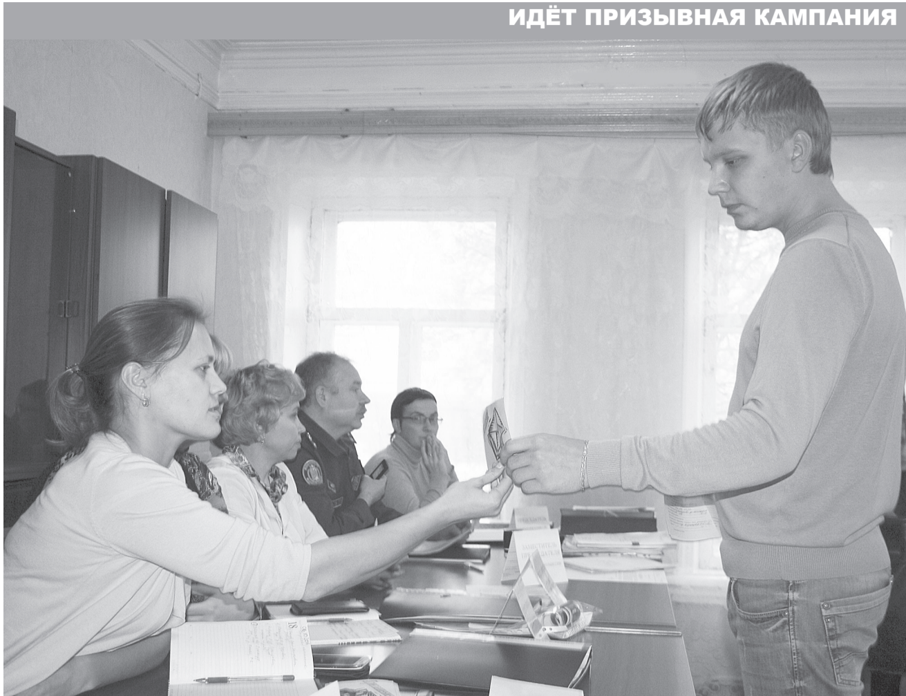
К службе готов!