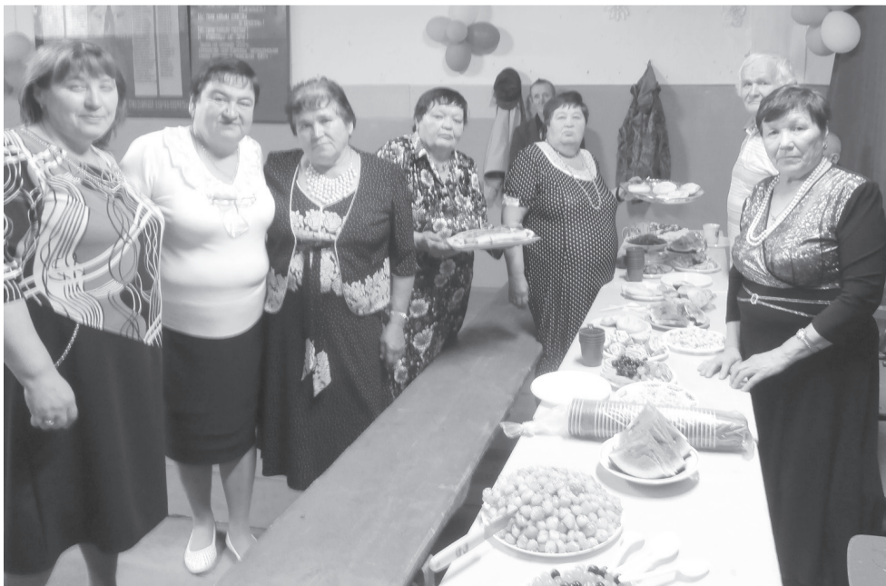
Сейчас будет дегустация конкурсных блюд!